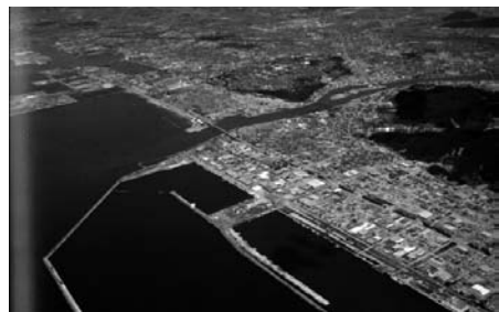
図20 宮城県石巻市（震災後）