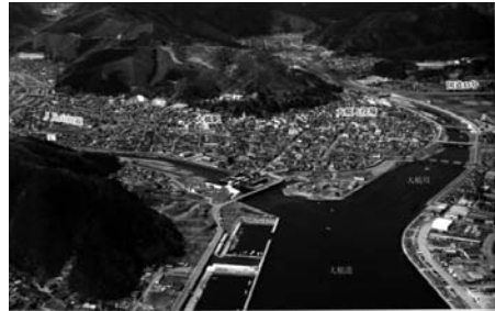
図5 岩手県上閉伊郡大槌町（震災前）

震度が観測データ不足により欠測扱いで、大槌町に隣接する釜石市中妻町で震度6弱、釜石市只越町で震度5強、山田町で震度5弱の観測に準拠している。防潮堤をはるかに超えて襲来した大津波は、防潮堤を一気に破壊し、大火災を引き起こして街の大部分を喪失させた。