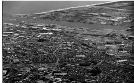
図21 宮城県仙台市沿岸（震災前）

発災後、市災害対策本部が直ちに設置され、救急救命や被災状況の把握等に努めた。大規模な余震が続いていたこと、更には市内停電のため、職員は住民対応にあたった。