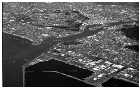
図19 宮城県石巻市（震災前）

総合支所：河北総合支所、雄勝総合支所、河南総合支所、桃生総合支所、北上総合支所、牡鹿総合支所（大原出張所含む）、支所：渡波支所、稲井支所、萩浜支所、蛇田支所