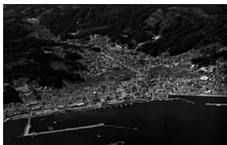
図4 岩手県下閉伊郡山田町 (震災後)