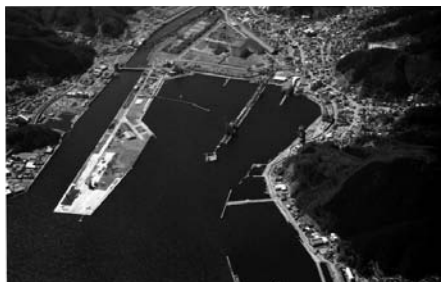
図8 岩手県釜石市（震災後）