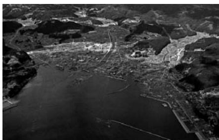
図16 宮城県本吉郡南三陸町(震災後)