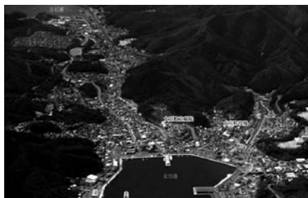
図17 宮城県牡鹿郡女川町（震災前）

文書は、庁舎1階と2階の文書庫及び執務室内に保管されていたがすべて流失した。女川町では、重要と考えられる文書について2000年度からマイクロフィルムからPDF化を行い、電子データは庁舎内と東京都八王子市の貸金庫に保管していた。庁舎内で保管していた原本、マイクロフィルム、PDFいずれも流失したが、他に保管されていた電子データにより歴史的資料の情報の消滅は免れていた。女川町では重要な書類は電子化し保管されていたが、現用文書については電子化がなされておらず、紙ベースの台帳類の流失に関して事務執行上支障をきた