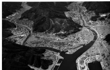
図6 岩手県上閉伊郡大槌町（震災後）

内訳：総務部、民生部、産業振興部、地域整備部、復興局、水道事業。[2011年12月時点]。