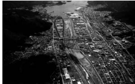
図10 岩手県大船渡市（震災後）

大船渡市では、沿岸全域に津波被害が発生し、越喜来湾沿岸付近に位置していた三陸支所庁舎1階全体及び2階庁舎の一部が浸水した。このため、当時、本庁舎から預かっていた資料も含め、多くの文書が被災した。これに対し、2012年5月10日、国立公文書館が現地にて実状調査等を行ったところ、被災公文書等は旧崎浜小学校に搬送、保管され、修復すべき資料の選別や所管課の確認が行われていたところであった。同市では、支所の移転や被災状況の確認等のため、支援事業を要請するまでに時間を要したものの、膨大な被災公文書等を早急に修復し、歴史資料として重要な公文書等として将来の保存と利用に備えたいという意向を持っていた。同市からの要請に基づき、国立公文書館修復支援事業を実施することとした。実施期間は、2012年7月17日～9月14日（44日間）。実施場所は、旧崎浜小学校（岩手県大船渡市三陸町越喜来字仲崎浜183）である。