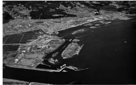
図12 岩手県陸前高田市（震災後）