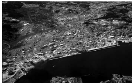
図14 宮城県気仙沼市(震災後)