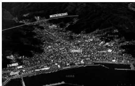
図3 岩手県下閉伊郡山田町 (震災前)