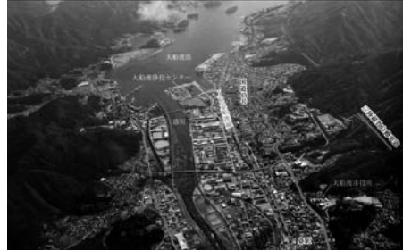
図9 岩手県大船渡市（震災前）

内訳：企画政策部、総務部、生活福祉部、商工港湾部、農林水産部、都市整備部、教育委員会、選挙管理委員会、監査委員会、農業委員会、三陸支所