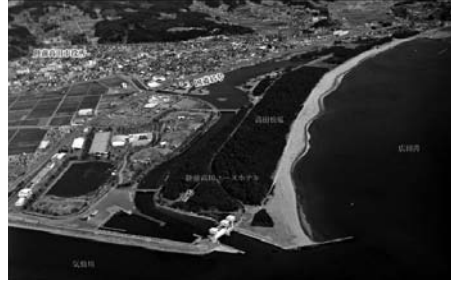
図11 岩手県陸前高田市（震災前）