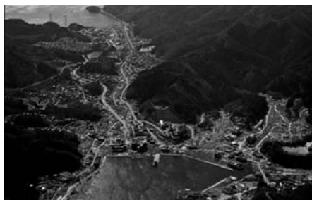
図18 宮城県牡鹿郡女川町（震災後）