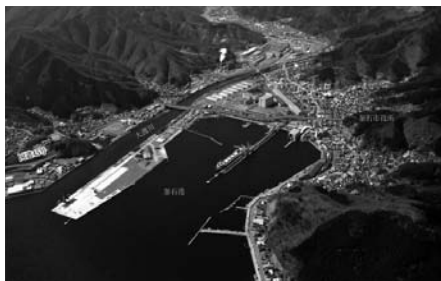
図7 岩手県釜石市（震災前）

第1～5庁舎付近は、瓦礫の山積で移動困難となり、市内全域が停電で通信も途絶したため、3月14日に市災害対策本部をシープラザ釜石へ移設した。