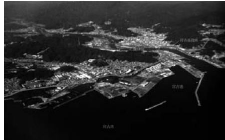
図1 岩手県宮古市（震災前）

本庁舎1階の総合窓口が津波により水没、住民情報システムのサーバが停電のため、サーバ類を大型の非常用発電装置がある新里総合事務所（大型の非常用発電装置装備）へ移設し、3月14日に窓口業務を再開。新里総合事務所以外の窓口では、申請・届出の受け付けの紙を新里総合事務所に送って処理をした。3月28日からオンラインによる異動処理を再開。罹災証明書の発行は、3月20日頃から行い、義援金と被災者生活再建支援制度の受付は、4月27日。