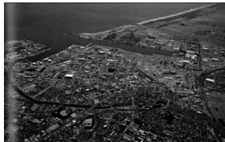
図22 宮城県仙台市沿岸（震災後）