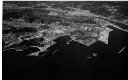
図2 岩手県宮古市（震災後）