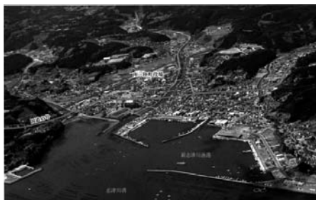
図15 宮城県本吉郡南三陸町(震災前)

情報化推進係は、3月11日時は企画課に属して3名体制であった。システムは、基幹系システム(住基・税・福祉等)及び内部情報系システム(シンククライアント及び文書管理等)を担当していた。フルバックアップは週1~2回、差分バックアップは毎日、テープ及びストレージ上に保存し、電算室内で保管していた。電算室は、防災対策庁舎の2階にあったため、サー