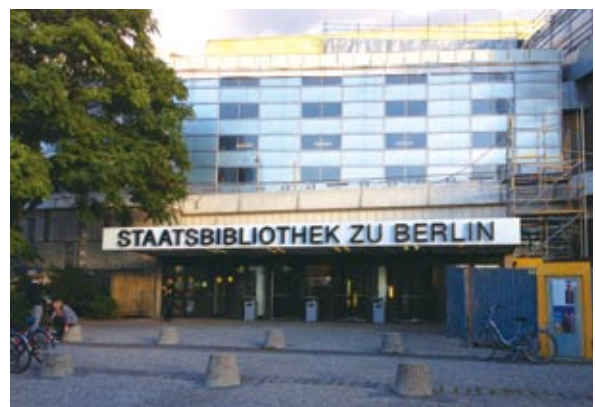
ベルリン国立図書館

なお、EAJRSのホームページ( http://ejjrs.net )から、今大会のプログラムと発表抄録がPDF形式で閲覧又はダウンロードできます。(田中 梓)