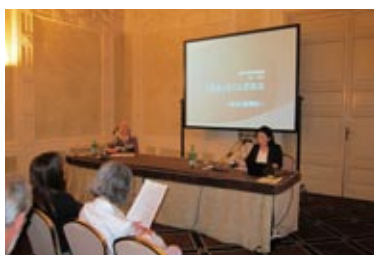
「日本文学のことばの力」共同研究集会