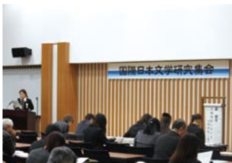
ショートセッション