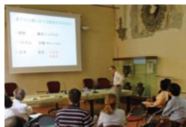
日本古典籍における【表記情報学】