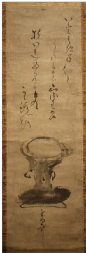
図1 「明恵上人自画賛」 （山内恭彦氏・鈴木皇氏旧蔵 本紙 縦65.5cm、横20.6cm）

明恵に興味を持った人が最初に手に取る基本書の一つに、岩波文庫の『明恵上人集』がある。『明恵上人歌集』『明恵上人夢記』『梅尾明恵上人伝記』を収め、この一冊で明恵の和歌と夢と人生を概観することができる。その校注を担当された久保田淳先生から、ある人の所蔵する明恵筆の掛け軸の真贋を鑑定してもらいたいとの依頼があった。2005年の春、依頼の手紙とともにその軸の写真（図1）が送られてきた。