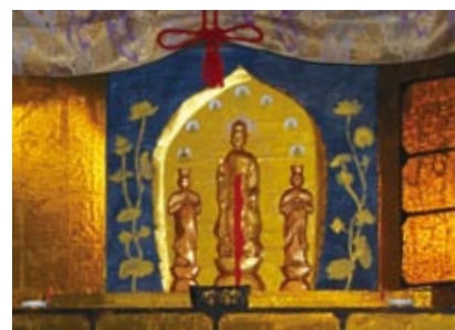
クライマックスシーンで天寿の身代わりとなり胸から血を流す阿弥陀像

今回の復曲公演によって、最初期の人形浄瑠璃が抱えていた課題を垣間見ることができました。古浄瑠璃の読み物化を研究テーマとしている私にとって、絵入りの草子本を用いて試みられた今回の復曲事業は大変刺激的なものでした。関係者の皆様に厚く御礼申し上げます。