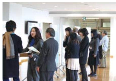
ポスターセッション