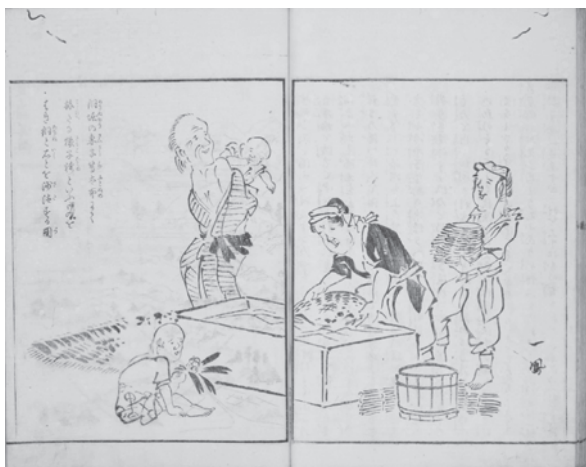
図2 足尾銅山で働く女性の姿 (『日光山志』巻之四、国文学研究資料館所蔵)