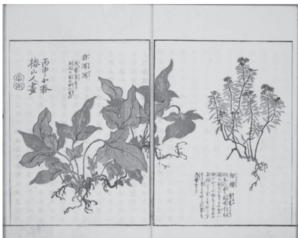
図1 岩沢瀉・梅桜の図