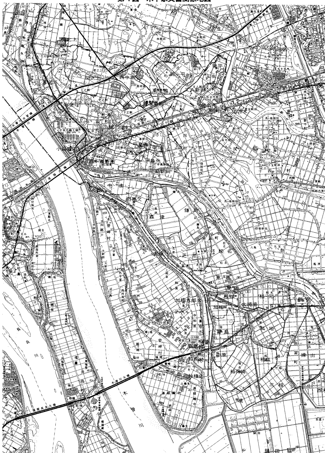
第4図 木下家文書関係地図