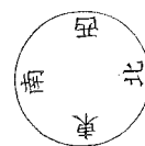
第2図 鎌倉新田絵図